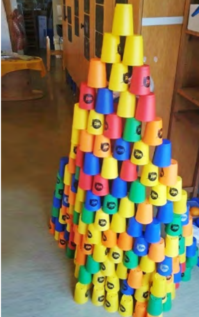
Orangenberg wie auf dem Markt.